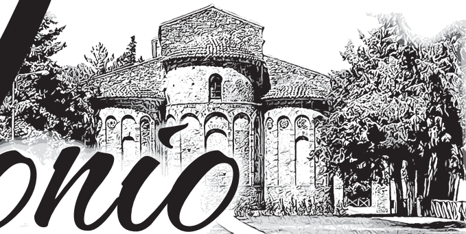
ROSSANO - ABAZIA DI SANTA MARIA DEL PATIRE