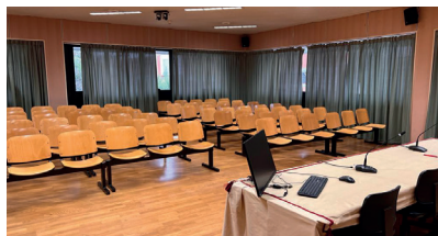
SALA "BRUNO DA LONGOBUCCO" (max 80 posti)

Il ricondizionamento dei dispositivi medici: lo stato dell'arte - Tommaso Risitano